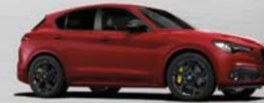
414 Rosso Alfa