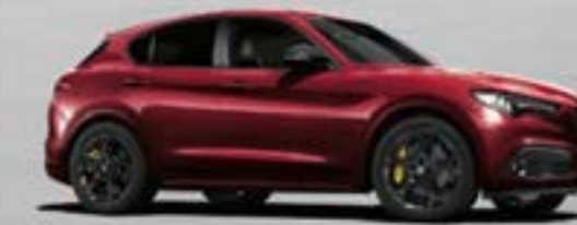
438 Rosso Etna