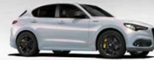
252 Perla Lunare