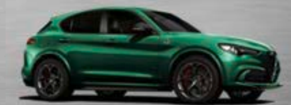
646 Verde Montreal