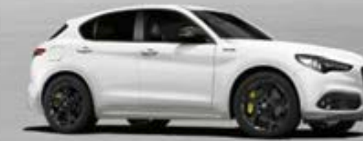
217 Bianco Alfa