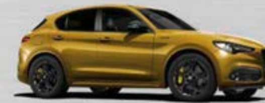
437 Ocra Lipari