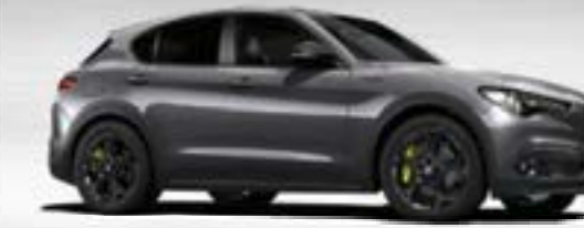
035 Grigio Vesuvio