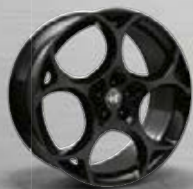
TURISMO, dunkel lackiert