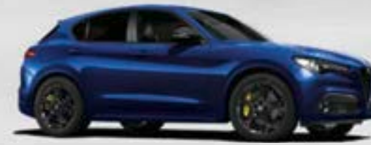
486 Blu Anodizzato