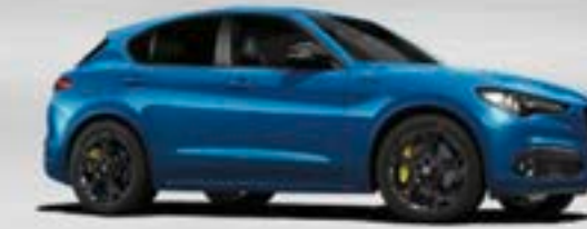
756 Blu Misano