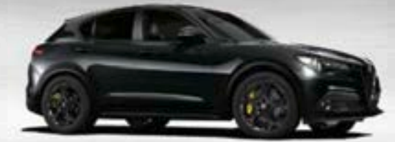
408 Nero Vulcano