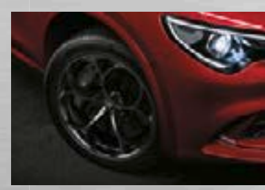
CLASSICO, dunkel lackiert